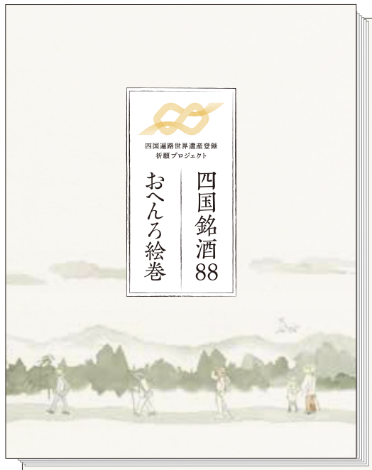
▲少し小さめの納経帳のようなデザイン(表紙サイズ13.5×10cm)。製本はすべて手作業です。