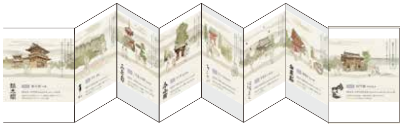
▲中は蛇腹になっており、へんろ道がつながった「おへんろ絵巻」が完成します。