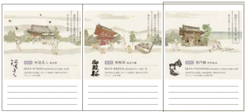
▲お酒の感想をメモしたり、酒蔵めぐりのお供としても活用できます。